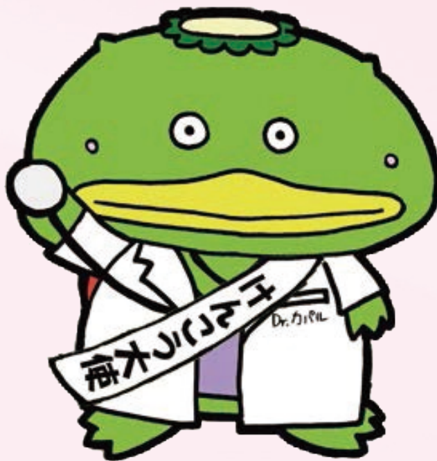
カバル 埼玉県けんこう大使・志木市広報大使