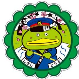
▲オリジナルのヘッドマーク (走行時は付きません)

市では、カパルやその仲間たちといっしょに旅をしたいというファンの強い要望を受け、東武鉄道と協力し「志木市広報大使カパルと行く東上線ツアー」を開催します。