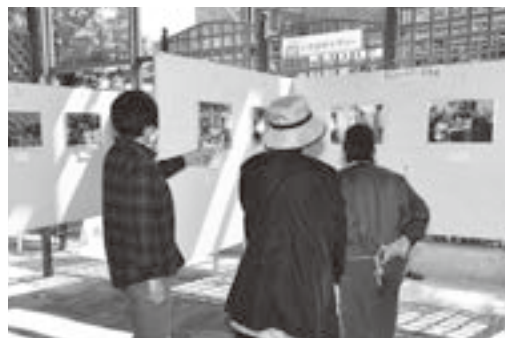
▲昨年開催された市民カメラマン写真展の様子