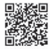
志木市議会 議長交際費▶ QRコード

http://www.city.shiki.lg.jp/index.cfm/35.html