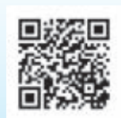
志木市議会 フェイスブック QRコード

志木市議会では、大規模な災害が発生した場合に、議会として情報発信を積極的に行っていくために、市議会のSNSを開設しております。下のQRコードから皆様のフォローをお願いいたします。