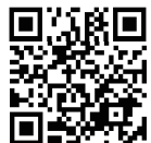
志木市議会インターネット中継 QRコード▶

アクセスが集中した場合や、ご使用になる接続環境によっては、中継をご覧いただけないこともありますのであらかじめご了承ください。