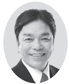
今村 弘志 公明党