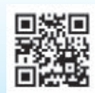
志木市議会 ツイッター QRコード

※志木市議会SNS（フェイスブック、ツイッター）は「志木市災害対策支援本部」を設置した際に使用するため、通常時は使用しません。また、それぞれのSNSに寄せられたコメント等については、返信や回答を行いませんのでご了承ください。