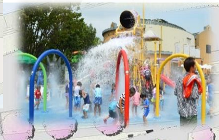
ウォーターパーク