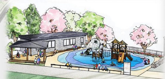
水と親しむ親水空間