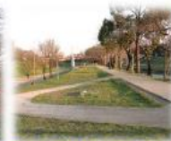
整備されたスロープは 車イスの走行も可能!!