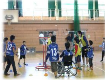
色別対抗スポレク合戦『頂上決戦2018』 バスケ+ハンドボールの新種目“リングボール”