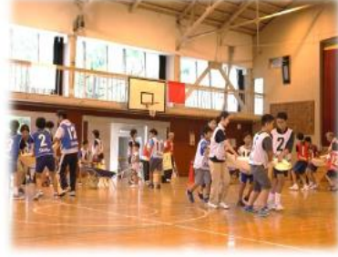
スポーツ×レスキュー『かしわな防災運動会』 6歳～85歳までの参加(担架リレーのようす)