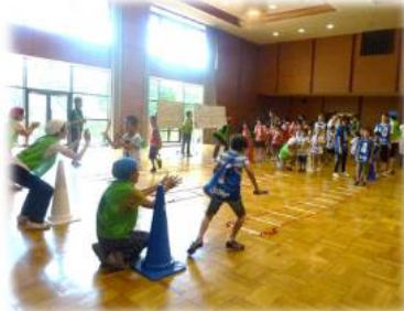
クローバー×宗岡四小学童保育クラブ 合同レク(ラダーリレーのようす)