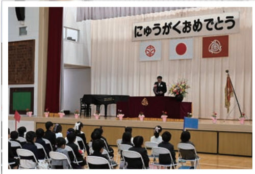
▲宗岡第二小学校の様子