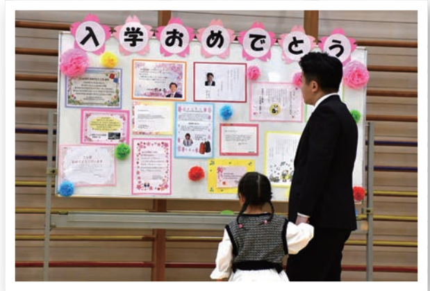
▲お世話になった方々からのメッセージ

現在、市内では小学生574人、中学生665人の新入生が、それぞれの学校で仲間とともに新たなステージでの学びを進めています。