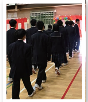
▲新たな一歩のスタート