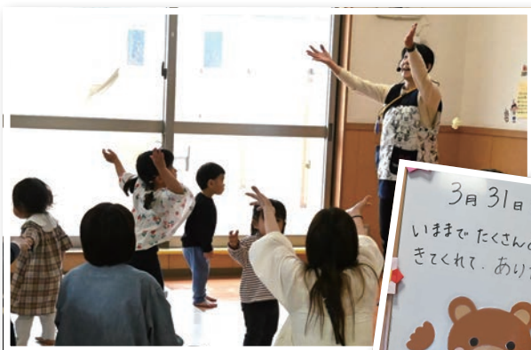
▲楽しい笑い声が響き渡ります

地域の子育て支援の拠点として、19年間多くの親子に利用いただいた西原子育て支援センター「まんまある」が3月31日をもって閉所しました。