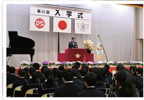
▲宗岡第二中学校の様子