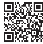
▲申込みフォーム(団体)