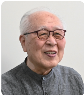
大正大学名誉教授 小児科医