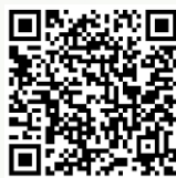
研究報告 QR コード

引き続き、充実した教育活動を実践していけるよう、宗岡せせらぎ学園全体の指導の質を高める研修を推進していきます。