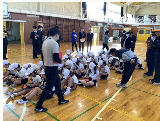
小・中学校の教職員による 6 年生体育の授業公開の様子