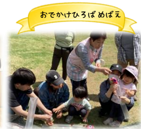
おでかけひろばめばえ