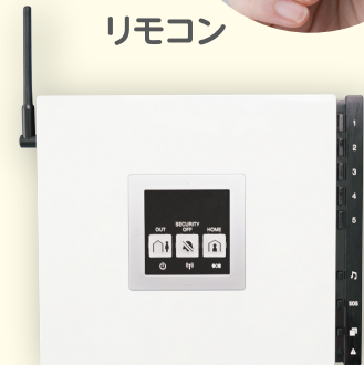
セキュリティコントローラー