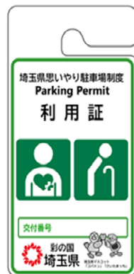
その他障がい者、 要介護者等用