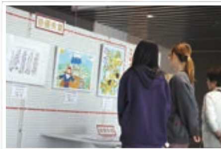
▲展示作品を観賞して芸術の秋を楽しみます