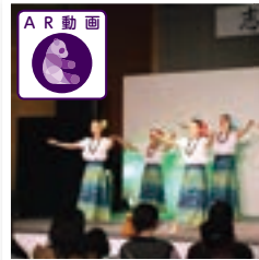
▲▶日頃の練習の成果を披露しました