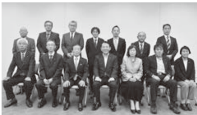
▲農業委員会委員の皆さん、香川市長