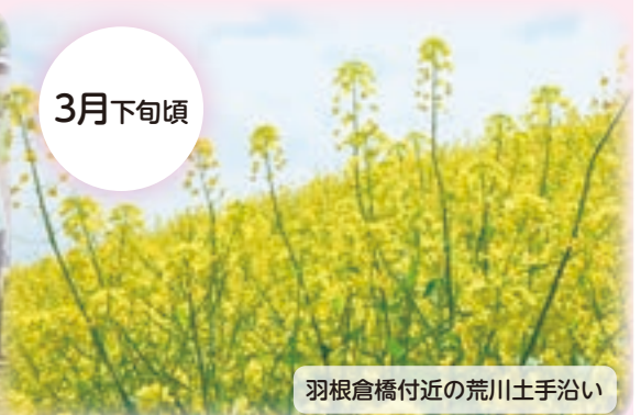
羽根倉橋付近の荒川土手沿い