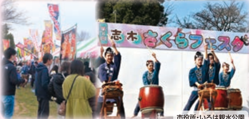
市役所・いろは親水公園