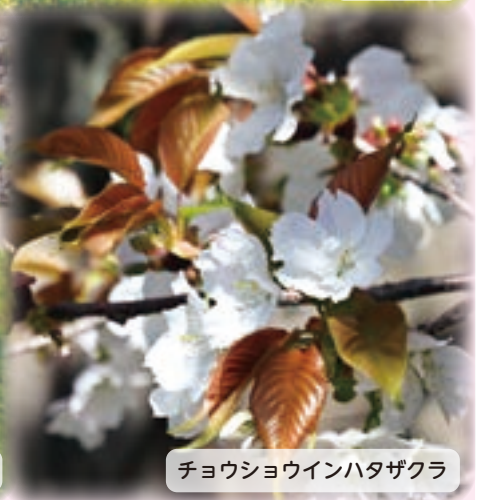
チョウショウインハタザクラ