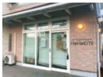
パンとピザのおみせ HoHoEMi

中宗岡1-4-61 営業時間/11時～15時 定休日/日・月曜日 電話番号/☎048(423)3560