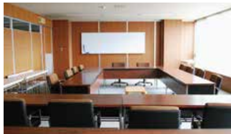
第2・3委員会室（庁舎4階）