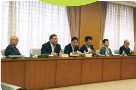
愛知県豊田市視察の様子