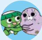
カッピー & あらちゃん