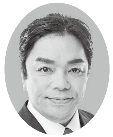
今村 弘志 公明党