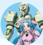
いろは水輝 & 4式ロボ