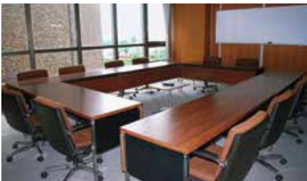
第1委員会室（庁舎4階）