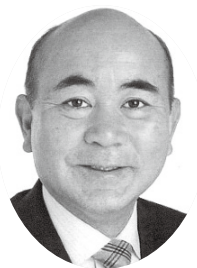
高浦 康彦 日本共産党