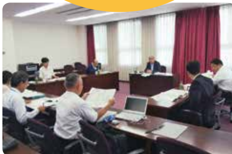
滋賀県守山市視察の様子