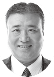
吉川 義郎 公明党