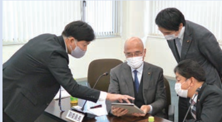
▲富士見市議会での視察の様子

志木市議会では、令和3年12月1日に議会のICT化、ペーパーレス化の推進、タブレット端末の導入などについて調査・研究するために「志木市議会ICT推進会議」を設置しました。