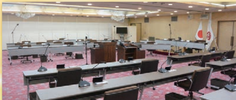
▲志木市議会仮庁舎（第4庁舎）議場

令和4年6月定例会は市役所仮庁舎（市民会館）で行う最後の定例会です。ぜひ、傍聴にお越しく下さい。