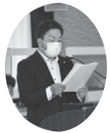
今村 弘志 公明党