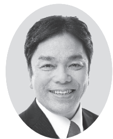
今村 弘志 公明党