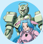
いろは水輝& 4式ロボ