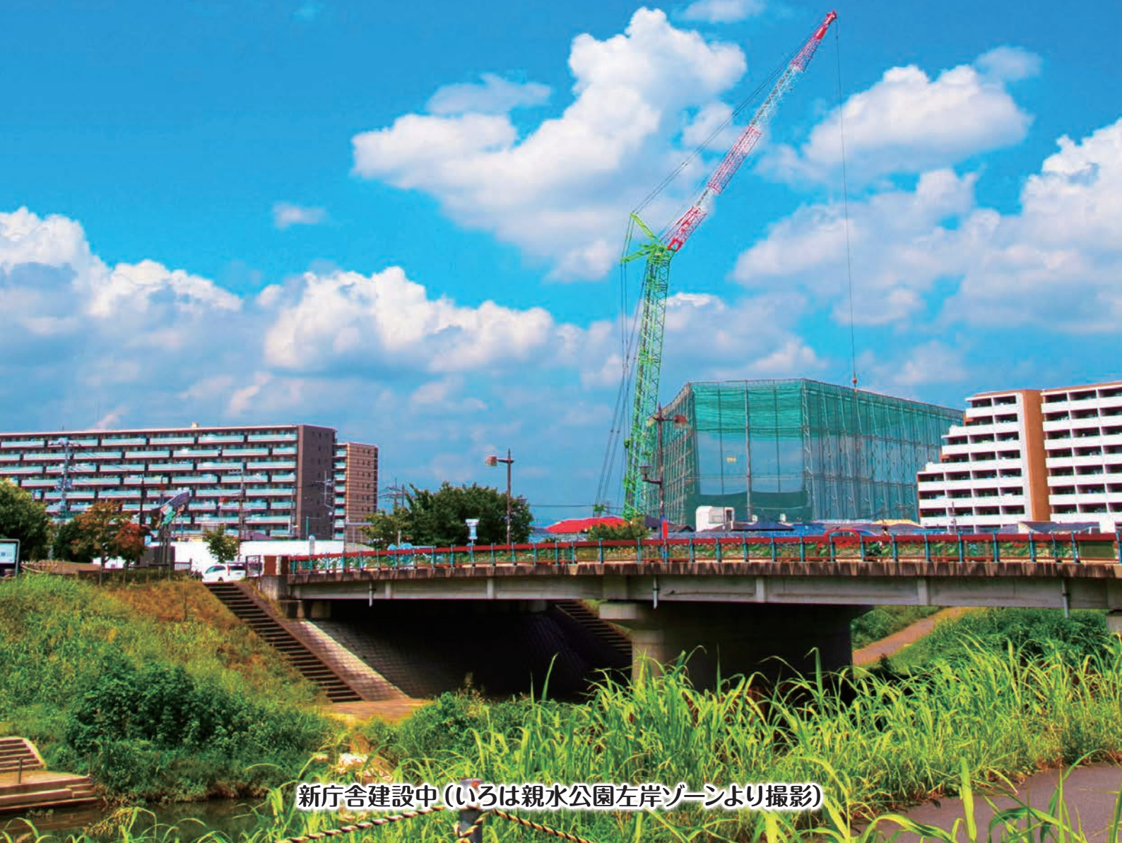
新庁舎建設中（いろは親水公園左岸ゾーンより撮影）