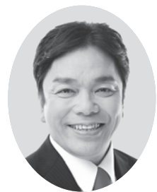
今村 弘志 公明党