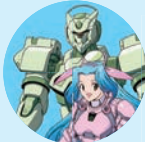
いろは水輝&4式ロボ