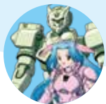
いろは水輝& 4式ロボ