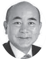
高浦 康彦 日本共産党

本市では、令和2年度に、統合型校務支援システムや電子黒板のさらなる整備を計画し、教育のICT化に取り組んでいるところである。子どもたちの発達段階や学習実態に合わせ一人ひとりの学びを支援できるよう計画的にICT環境の整備に努めていく。