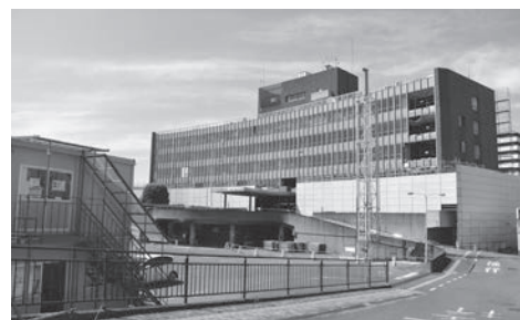
解体工事が進む、旧庁舎