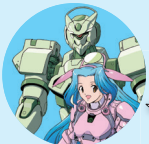
いろは水輝 & 4式ロボ