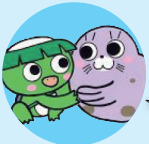
カッピー & あらちゃん