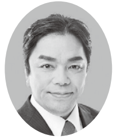
今村 弘志 公明党