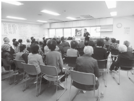
交通安全の意識を高めるために講話を実施しています

高齢者の運転によるさまざまな交通事故が多発し社会問題化している。埼玉県では高齢ドライバーを対象とした参加型の講習会等を実施、県警察では、高齢者の運転免許証の自主返納を促す