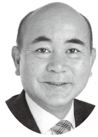
高浦 康彦 日本共産党