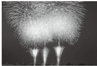
市制施行45周年を迎えた昨年度は、市民花火大会が開催されました

毎年開催することについては、本市の財政負担も十分考慮しなければならず、多くの市民の皆様にご協賛金をいただくなければ実現しないことから、花火大会を応援いただく皆様に、例えば、協賛金はしっかりと応援するから花火大会は毎年開催しようといった機運があるのかどうか今後確かめながら、観光協会の皆様と一緒に今後の方向性を議論していきたい。