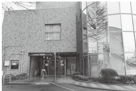
建てかえが検討されている市民会館管理棟

判定会の意見を十分に考慮した上で、公共施設等マネジメント戦略を踏まえ、今後、議会の意見はもとより、文化団体や利用者の皆様の意見もお聞きした上で、この議論を進めてまいりたいと考えている。