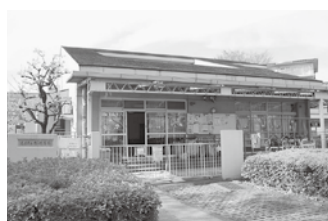
志木ニュータウン内の館保育園

館地区は現在、市内で最も高齢化が進んでおり、地域交流や世代間交流の拠点としても位置づけができるよう、さまざまなノウハウを取り入れた保育園の整備を進めていきたいと考えている。