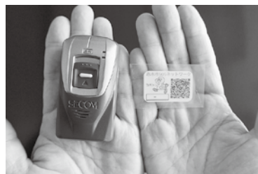
徘徊高齢者位置探索システム(写真左)と見守りSOSステッカー(写真右)

今後も引き続き、家族への支援とともに、計画的な地域で見守る体制づくりと一体的に、認知症サポーター養成講座などを通し、身近な病気であることとの理解を進めていく。