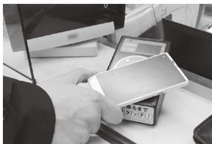
電子マネーの端末

電子マネーにより収受することについては、法令に明確な規定がないことから現時点では困難と考えているが、総務省において地方自治体が直接行う業務への電子マネー決済の導入について検討が行われていることから、国の動向を注視しつつ慎重に判断していく。