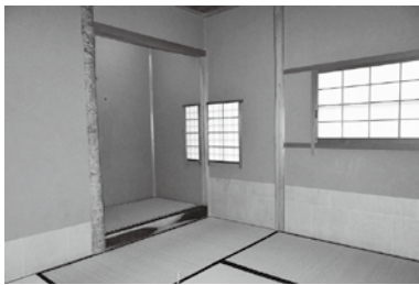
総合福祉センター内にある現在の茶室

市としても、利用者の皆様に最大限の配慮をした上で整備を進めていきたいと考えています。