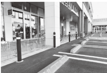
市内商業施設に設置されている車止めポール

また、公共施設については、各施設を調査し、必要に応じ、適切な対応を図っていきたいと考えている。