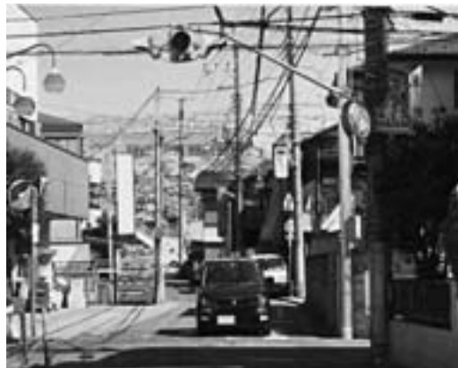
柏町1丁目交差点の1灯式信号機

●病院事務部長 市民病院は、さまざまな高度医療機器の効果的な活用を図り、受診者への安心・安全な医療の提供に努めている。今後は病気予防の最前線の機関として、疾病の早期発見に活用していく考えであり、医療機器の説明も市民に知らせていく。