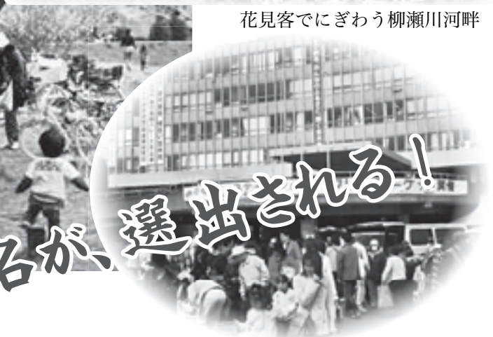
さくらフェスティバル