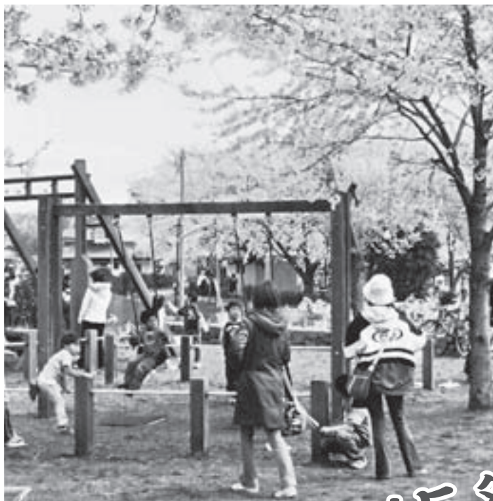
新河岸川河畔の広場