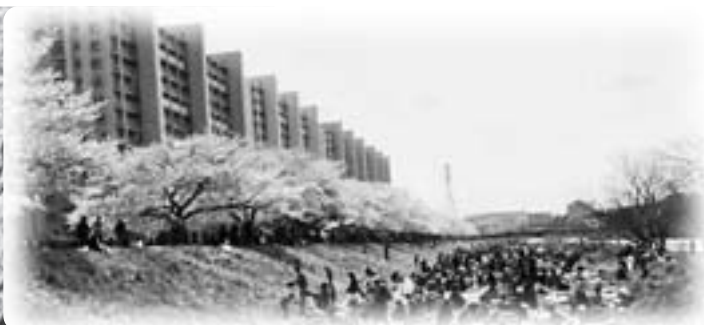
花見客でにぎわう柳瀬川河畔