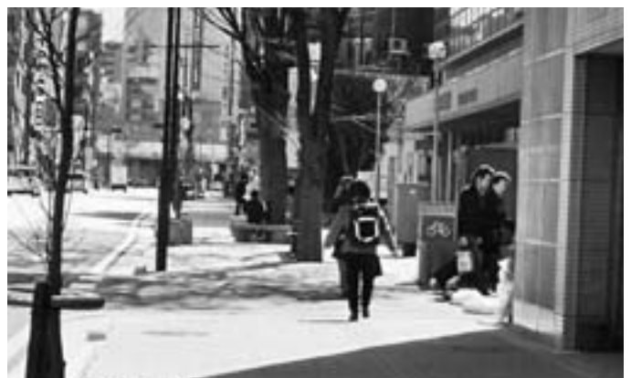
志木停車場線の広がった歩道

●まちづくり・環境推進部長 中央通停車場線の歩道における歩行者と自転車の通行区分は、道路管理者である県によると、地元商店会の要望により設置した植樹帯があり、通行帯幅員が確保できないことから区分することは困難とのことである。