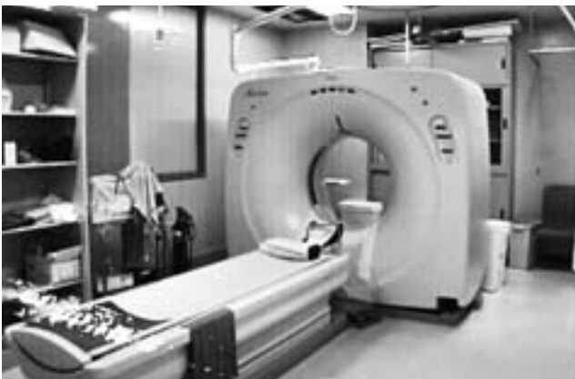
市民病院のCT スキャナー