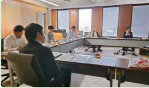
大阪府泉佐野市視察の様子