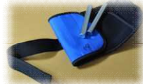
体操に使うおもり