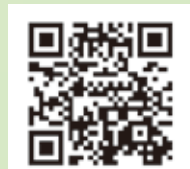
HPV ワクチン予防接種