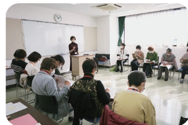
▲傾聴ボランティア養成講座