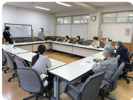
▼館・幸町協議体話し合いの様子

地域のことは地域の方に聞くのが一番です。皆様の力とお知恵を借りながら、安心して暮らせるまちづくりを目指します。今後も皆様のご意見をお聞かせください。