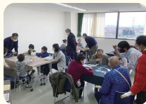
▲ボードゲーム体験の様子

3月2日(土) 総合福祉センターまつりの中で、地域活動の活性化を目的とした体験会が開催され、483人が参加しました。「大人も子どもも楽しめた」「またやってみたい!」といった声があり、障がいの有無・年齢・国籍を問わず交流を楽しんでいる様子が見られました。