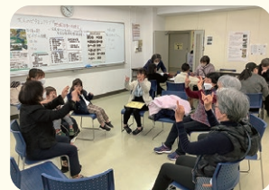
▲脳活性化ゲーム体験の様子