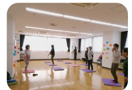
▲ろっ骨体操の様子