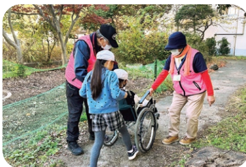
▲市内小学校で行った車イス体験