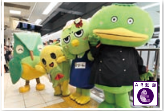
▲えんちゃん(東京都豊島区池袋西口商店街)、ふなごろう(千葉県船橋市)、カッパぐりーん(福島県会津若松市)が参加してくれました

当日は、車内でキャラクター達との写真撮影やオリジナル記念品がもらえるじゃんけん大会のほか、池袋駅での撮影会などが行われ、参加者は限られた時間の中でキャラクター達とのふれあいを大いに楽しみました。