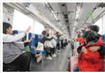
▲大熱戦のじゃんけん大会