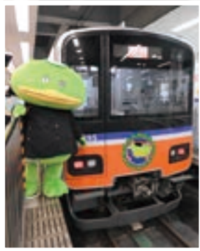
▲車掌になりきるカパル