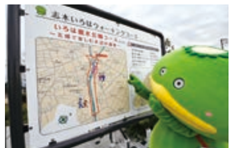
▲各コースのスタート付近に看板を設置

このウォーキングコースは、志木市いろは健康21プラン推進事業実行委員会(あるつく志木)の皆さんが、「歩いて楽しい」、「歩いて気持ち良い」をテーマにコースを提案し、埼玉県ふるさと創造資金を活用して実現しました。