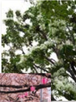
⑫なんじゃもんじゃの木