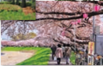
⑪柳瀬川土手の桜並木