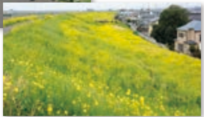
④荒川土手の菜の花