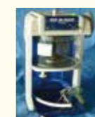
アイススライサー