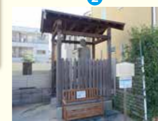
4 川口信用金庫志木支店前(2台)