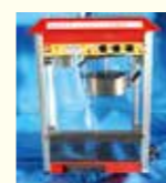
ポップコーンマシン

ポップコーンマシン / わた菓子機 イベント用長机 / パイプ椅子・ベンチ イーザーアップテント / アイススライサー 臼・杵 / 鉄板焼鉄板 / ガスコンロ など