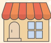
飲食店 店内にリボンを掲示