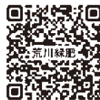
◀ 荒川上流河川事務所 ホームページ

河川の堤防の刈草から作った堆肥を配布します。 応募期間 12月8日(金)(当日消印有効)まで 配布期間(予定) 令和6年1月22日(月)～2月3日(土) ▼ 1月28日(日)を除く 申 往復ハガキで応募 ▼ 申込み多数の場合は配布数量を調整します。 ▼ 荒川上流河川事務所ホームページまたは、荒川上流河川事務所・出張所及び環境推進課で配布している応募要領をご確認ください。 問 荒川上流河川事務所荒川緑肥事務局 ☎049(246)1031