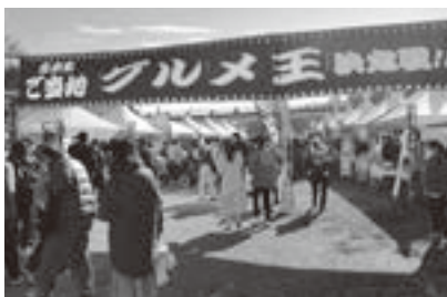
▲昨年のグルメ王決定戦会場の様子