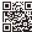
▲イベントホームページ

日 10月21日(土) 11時30分～19時 10月22日(日) 11時～17時 場 志木駅東口ペDESTリアンデッキ、マルイファミリー志木周辺 ▼お子さんが食べられるメニューもあります。 主 志木市商工会青年部 後援 志木市、志木市観光協会、志木市教育委員会 協力 株式会社志木都市開発、マルイファミリー志木、サッポロビール株式会社 問 志木市商工会 ☎048(471)0049 ▼詳しくは、イベントホームページ及びインスタグラムをご確認ください。