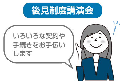
後見制度の普及啓発