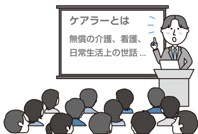
ケアラー普及啓発