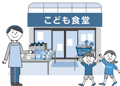
フードバンク事業