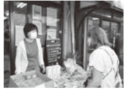
▲志木のまいにち子ども食堂の様子

市では、活動を通じて地域の人や団体、食を確保することが難しい人となつながら、協働することによって安心して暮らせる地域共生社会の実現を目指しています。