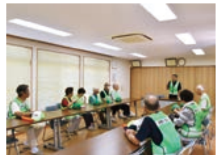
▲町内会館で行われた会議の様子