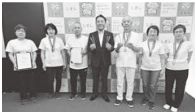
▲ 日本スポーツウエルネス吹矢協会志木中央支部の皆さん、香川市長

7月20日(木)、第5回全日本スポーツウエルネス吹矢団体選手権大会団体戦8メートルの部に出場し、優勝を果たした志木中央支部の皆さんが、優勝の結果報告に市長室を訪れました。