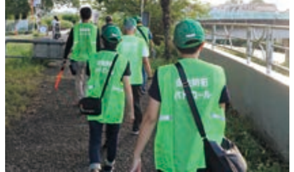
▲徒歩によるパトロールの様子

自主防犯パトロール隊は、安全・安心なまちづくりの実現に向け、各町内会が見回り活動をする曜日・時間帯を決め、徒歩によるパトロールを中心に行っています。