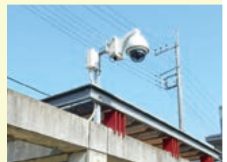
▲市内に設置している防犯カメラ

防犯カメラは、犯罪が発生した際の警察の捜査における貴重な証拠資料にもなることから、市は、さらなる犯罪抑止と犯罪の速やかな解決のため、令和5・6年度に新たに50台増設します。