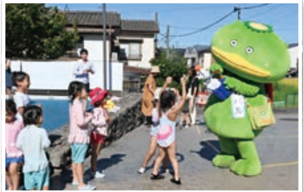
▲委嘱状交付式の後、ウォーターパークで子どもたちと水鉄砲で遊ぶカパール