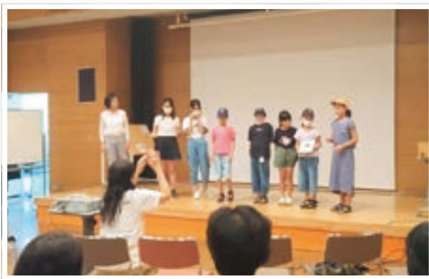
▲1人1ページずつ担当し、ていねいな手話で表現しました

8月2日(水)、いろは遊学館で志木市子ども手話教室の特別講演「手話による絵本読み語り」を開催しました。