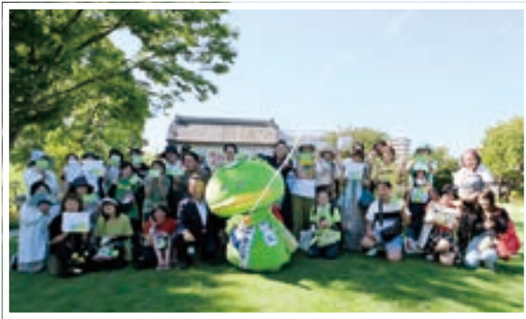
▲来場者ととも笑顔あふれる記念撮影

なお、当日の様子は、市公式YouTubeにアップしていますので、ぜひご覧ください。