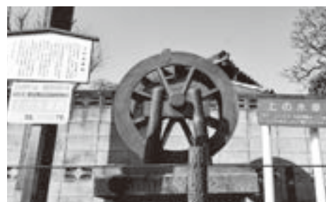
▲上の水車跡（本町3丁目交差点付近）

3市の市民・事業者で構成された「朝霞地区暴力排除推進協議会」を組織し、近年では手口が多様化・巧妙化している、暴力団による犯罪に対応するため、連絡会議、研修会、啓発活動や広報活動などを行っています。