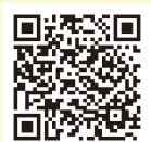
▲メール配信サービス