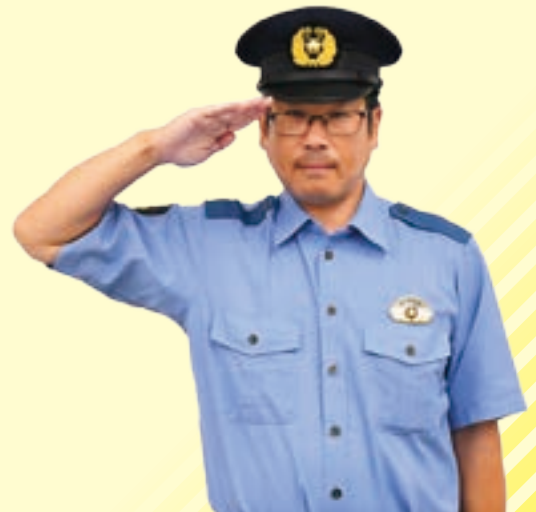
朝霞警察署生活安全課

新たに自動通話録音機能付き電話機を購入する場合は、社会福祉協議会が行っている詐欺被害防止電話機等購入費補助金を利用しましょう。