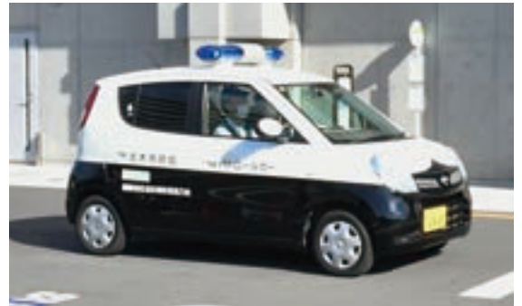
▲青パトによるパトロールの様子

回転灯を回しながらスピーカーを使って、特殊詐欺被害の防止を呼びかけたり、子どもたちの下校時には、周囲に不審者がいないか目を光らせて確認するなど、子どもから高齢者まで多くの市民の安全・安心を守っています。