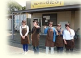
カレー屋さん すだち