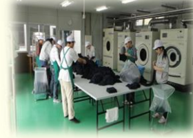
三芳すだち作業所