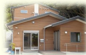
グループホーム こうづ

〒359-0011 所沢市南永井 867-1 所沢総合食品地方卸売市場内 TEL 04-2945-1038 FAX 04-2945-1049 メール sudachisagyousyo@yahoo.co.jp ホームページ http://sudachisagyousyo.web.fc2.com/