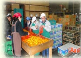
所沢すだち作業所