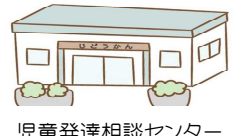
児童発達相談センター