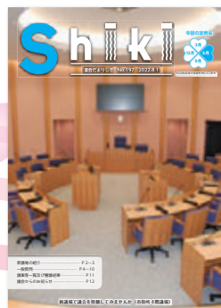
令和4年8月 第197号 新庁舎で業務スタート