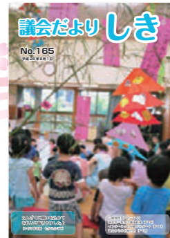
平成26年8月 第165号 議会映像をネット配信