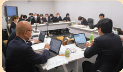
市民文教都市常任委員会の様子

議会ICT推進に向け、令和5年3月定例会からタブレット端末を試行的に導入しています。本会議及び委員会において、議案その他資料などを電子化し会議を行いました。