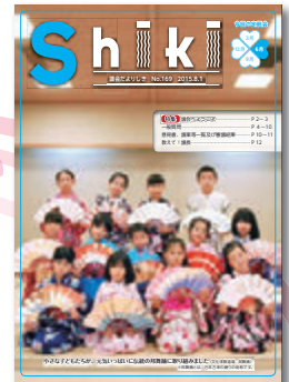
平成27年8月 第169号 デザインをリニューアル