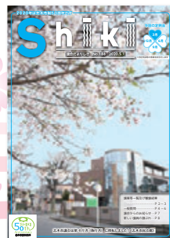
令和2年5月 第188号 仮議場を市民会館へ