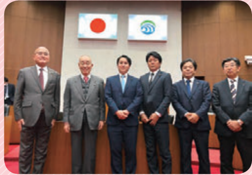
茨城県小美玉市 視察の様子

小美玉市議会は、本市議会が導入するタブレット端末の会議システムを利用している先進市のため、活用方法や導入効果、課題解決策などを調査・研究してまいりました。