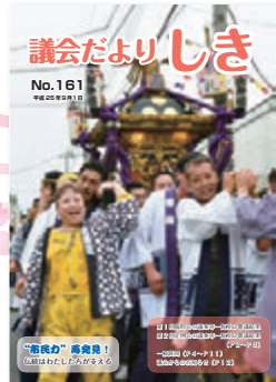
平成25年9月 第161号 新市政がスタート