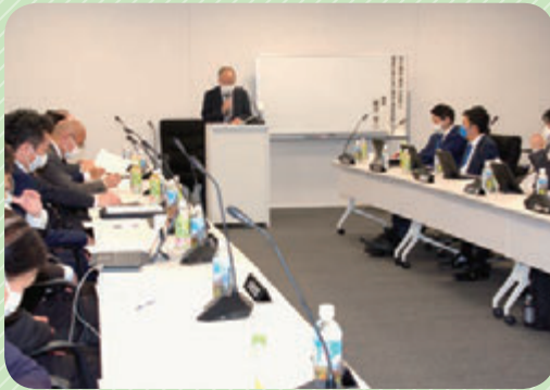
議員研修会の様子