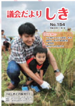
平成23年11月 第154号 カラー表紙にリニューアル