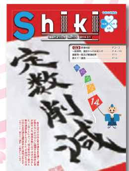
平成28年2月 第171号 議員定数を削減