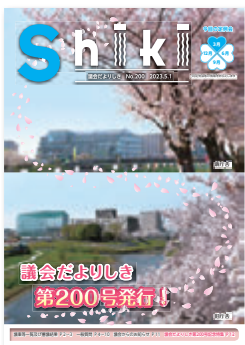
令和5年5月 第200号 創刊から50年