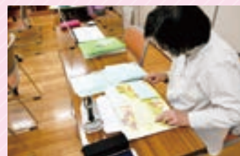
▲細かい作業が続きます