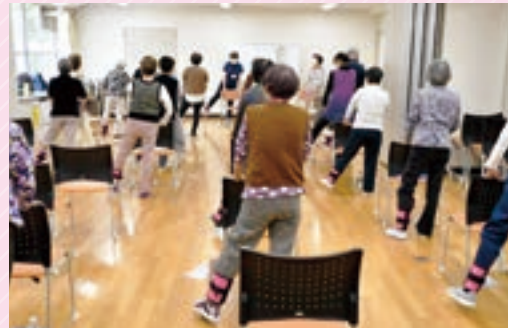
▲スタッフの声にあわせて体操は進みます