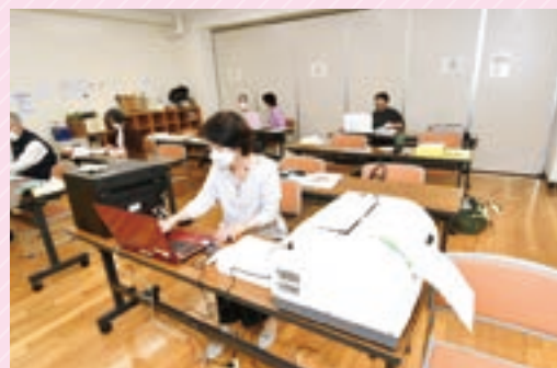
▲点字専用の印刷機を使って印刷します