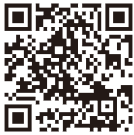
▲ふれあい館 「もくせい」の日記

コンセプトにある「健康維持増進事業の充実」と「世代間交流事業の継続」の推進として、多世代交流カフェを活用してさまざまなイベントを実施しています。イベントは毎月発行する「もくせいだより」でお知らせしています。詳しくはふれあい館「もくせい」ホームページをご覧ください。