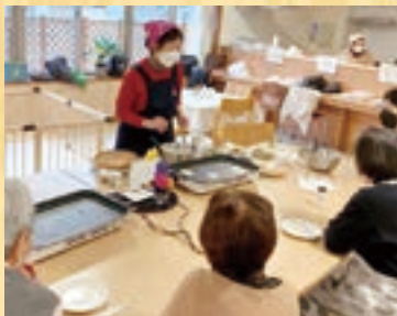
▲桜餅のワークショップを行った時の様子

市が育成している「しょく(食・職)場づくりサポーター」が中心となって活動するサロン団体「スマイルしき」が運営する体験