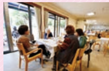
▲体操終了後はカフェを満喫