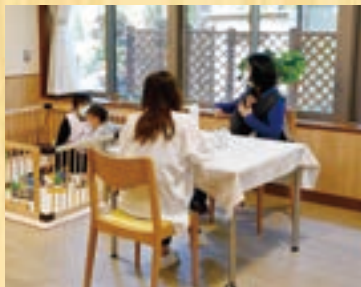
▲子どもを遊ばせながら相談ができます