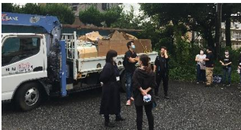
地域と学校の協働活動「環境整備」