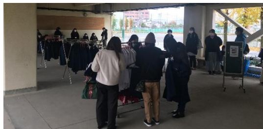
SDGsにもつながる「制服リサイクル販売」