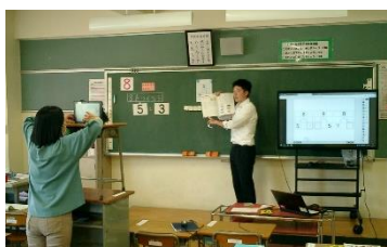
臨時休業期間における動画配信