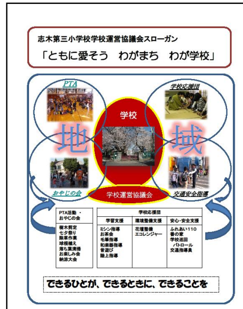
平成30年度リーフレット