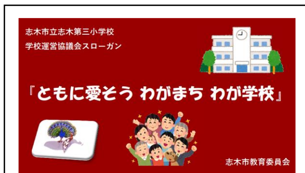
学校運営協議会の横断幕