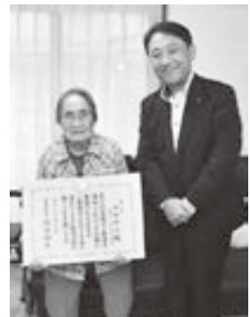
▲総理大臣からお預かりした銀杯とお祝い状をお渡ししました

これからも、高齢者の皆さまが住み慣れた地域で安心して元気に暮らすことができるよう、これらの取組を発展させていくとともに、皆さんの元気を志木市の成長につなげ、長寿社会をしっかりと支えるまちづくり、志木づくりを進めていきます。