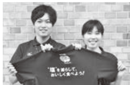
▲「おいしく減塩!『減らソルト』プロジェクト」推進のポロシャツ

こうしたことを予防するため、市では「おいしく減塩!『減らソルト』プロジェクト」を推進しており、保育園や小学校、中学校における減塩給食の実施や大東ガス(株)と連携した減塩の取組、また、ハウス食品グループ本社(株)と連携した食育推進事業など、「食」へのアプローチによる健康づくりを進めています。