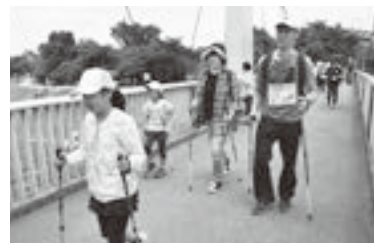
▲第5回ノルディックウォーキング・ポールウォーキング全国大会の様子

バロメーターともいえる小学生の体力測定において、志木市は県内平均を大きく下回る状況であり、運動が嫌いな子や体力がない子が増加している現状については、市民一人ひとりの健康を意識している市として大変憂慮しているところです。