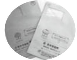
▲こちらの封筒を確認しましょう