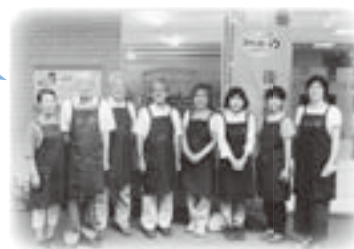
「スペース・わ」ボランティアの皆さん

スタッフの多くは「自分の時間を少し、地域のために使いたい」「私にもできることを何かしたい」という思いから講座を受講しました。高齢でも元気に過ごしたいという思いは、スタッフを含め皆に共通するものです。一日誰とも話をしないのは心身によくありません。「スペース・わ」のような所で、お茶を飲みながらチョットでも話をして、元気にお帰りになるといいなとスタッフ一同思っています。